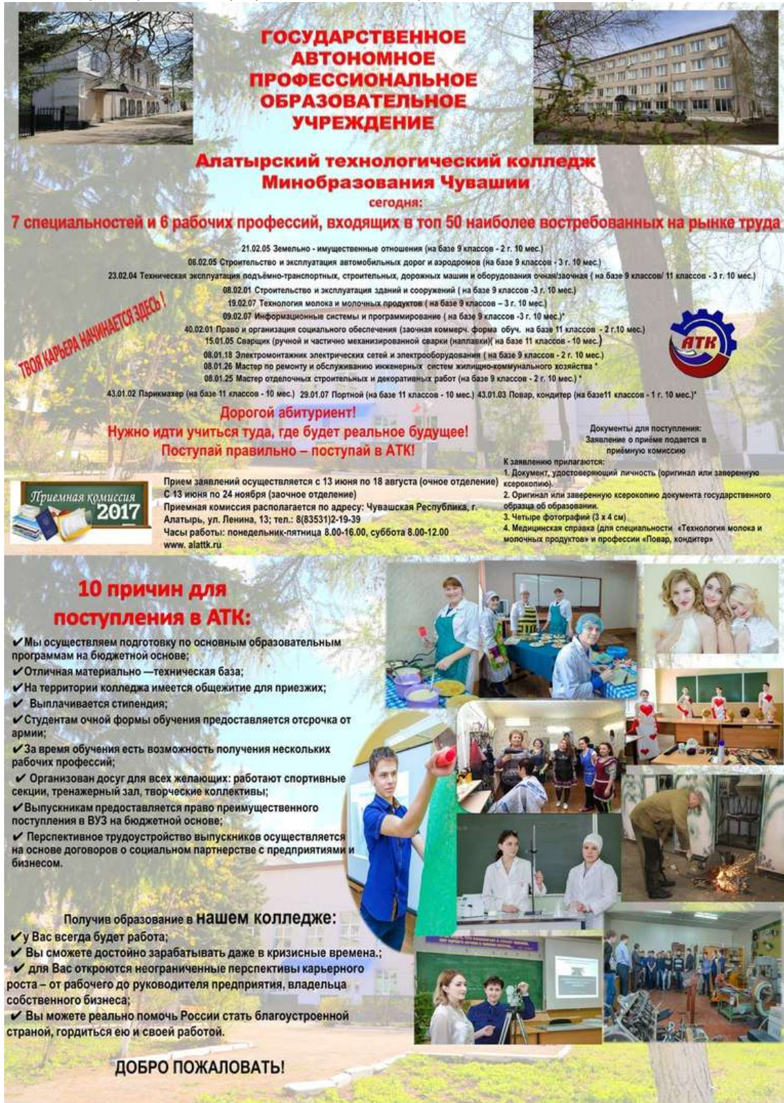
Рис. 1. Рекламный плакат колледжа