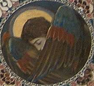
ἘΝΤΕΛΕΣΤΗΝ ΤΟΝ ΚΟΡΠΟΝ