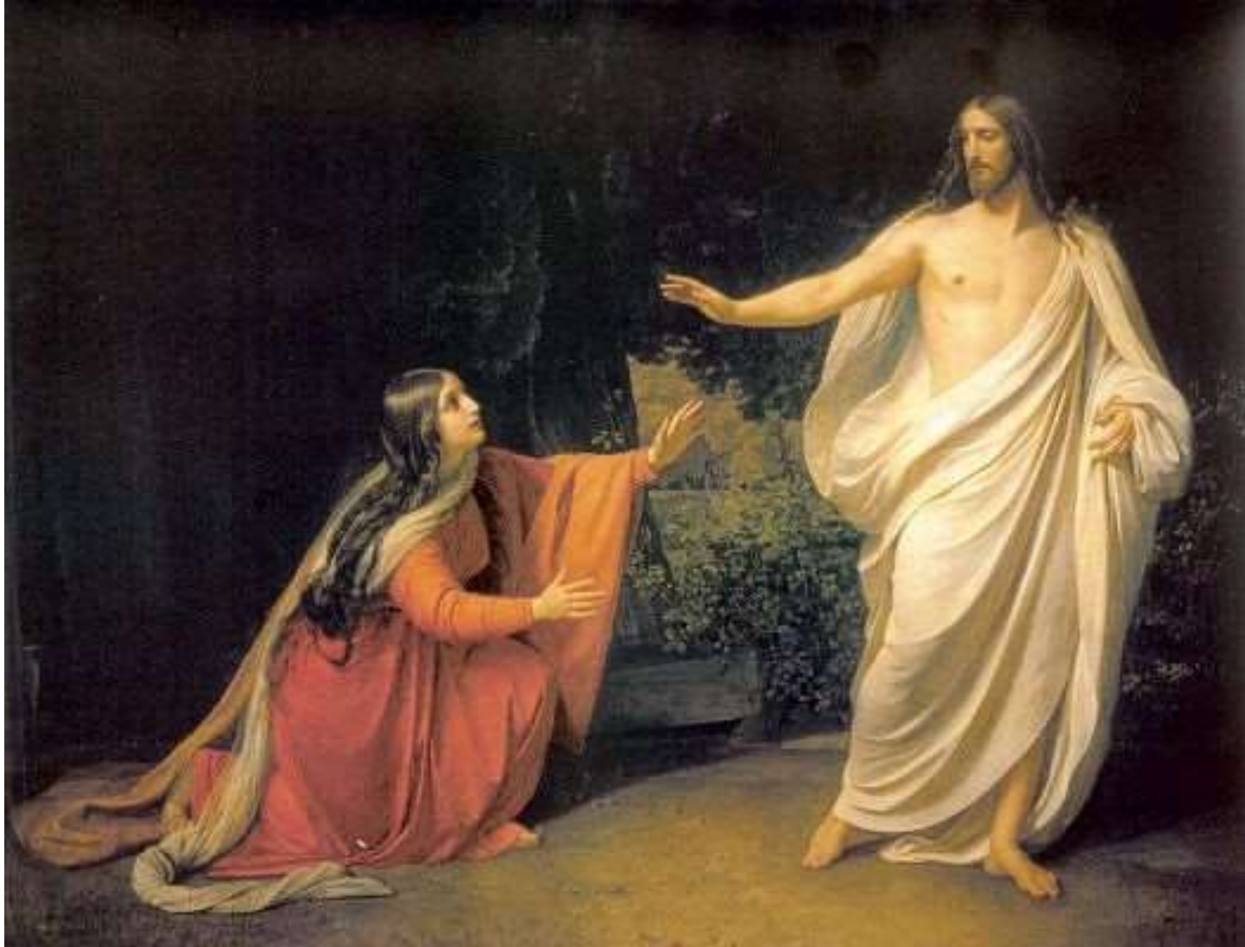
А.Иванов «Явление Христа Марии Магдалине» 1833 – 1835гг.