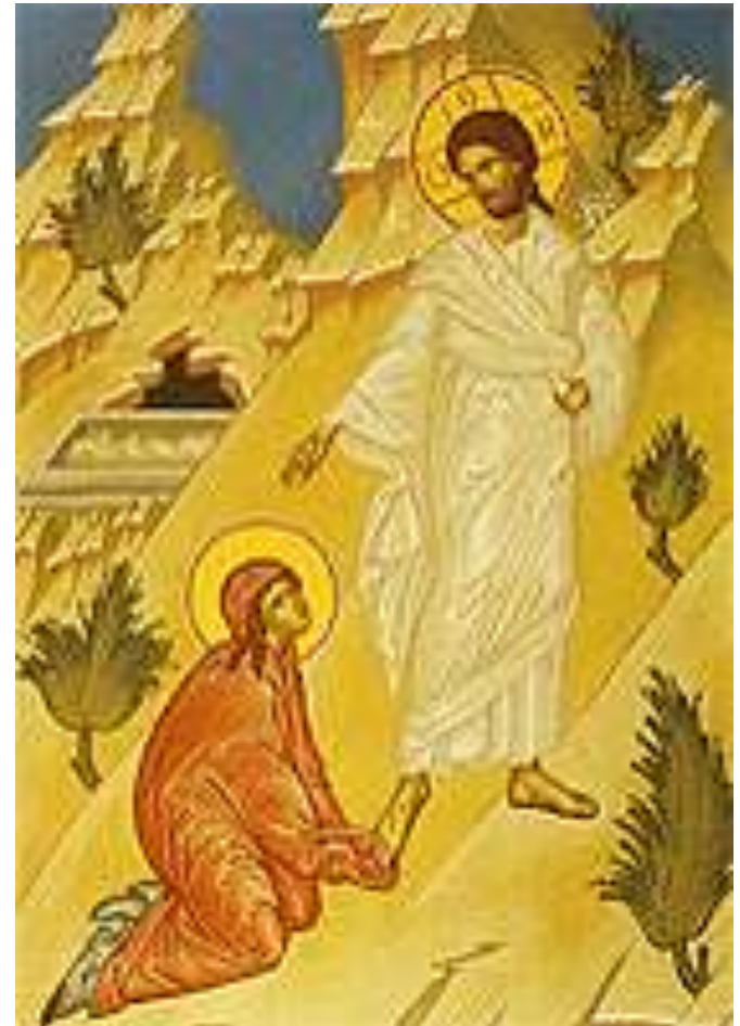
«Явление Христа Марии Магдалине»