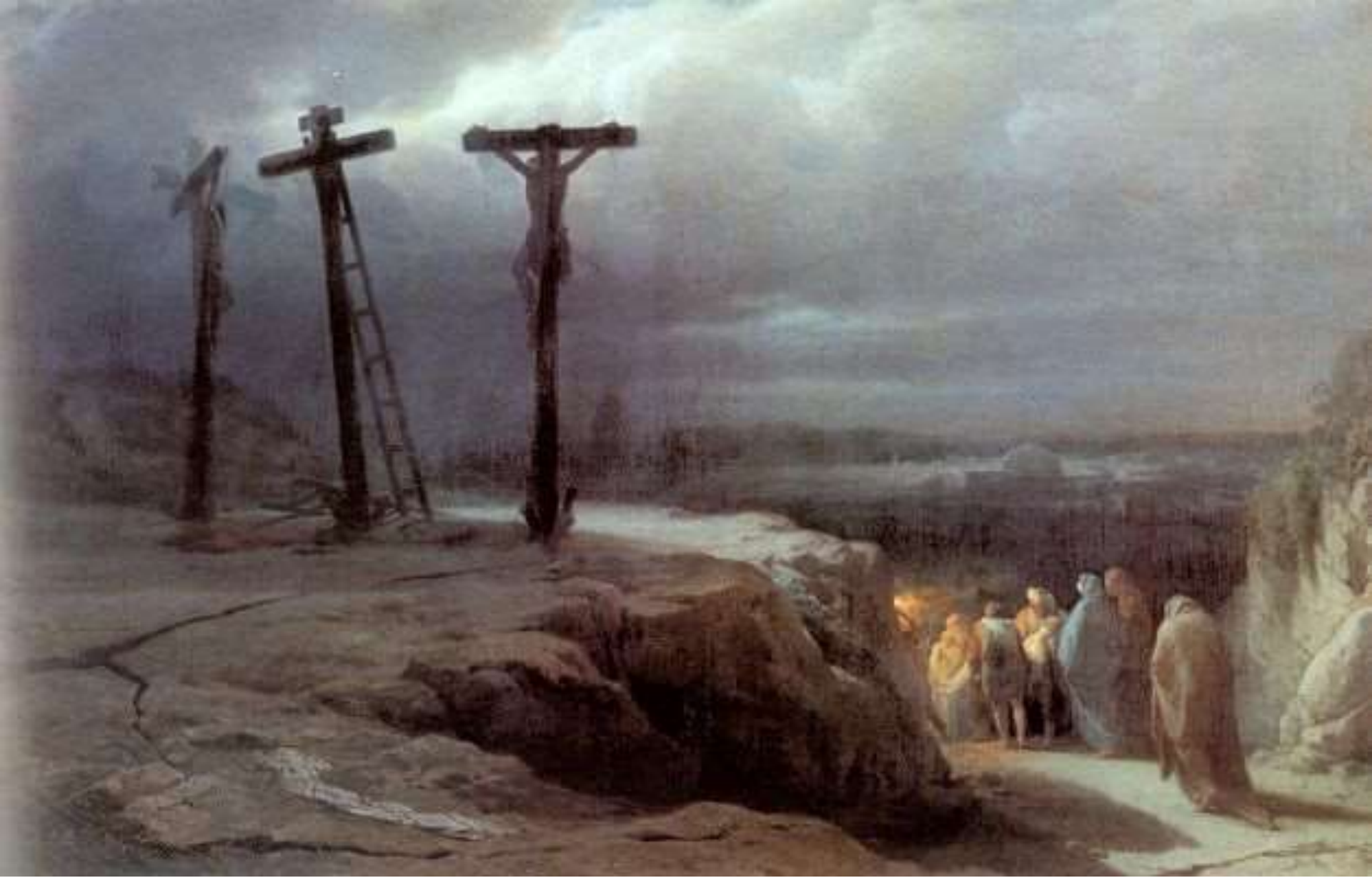
В.Верещагин «Ночь на Голгофе»