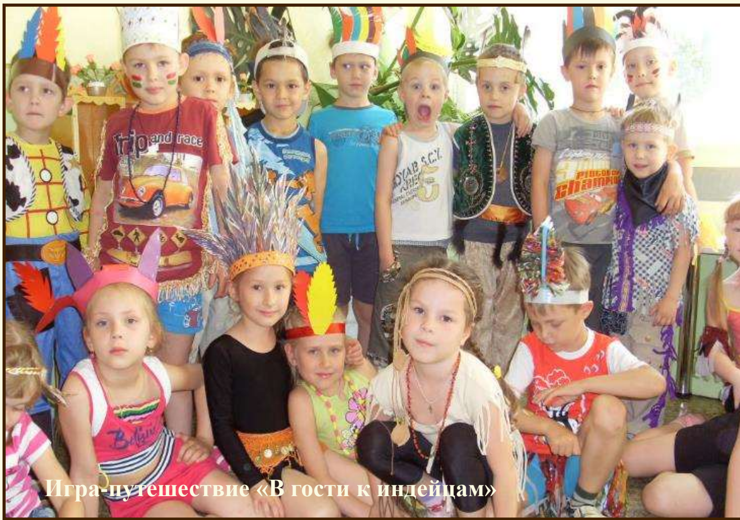
Игра-путешествие «В гости к индейцам»