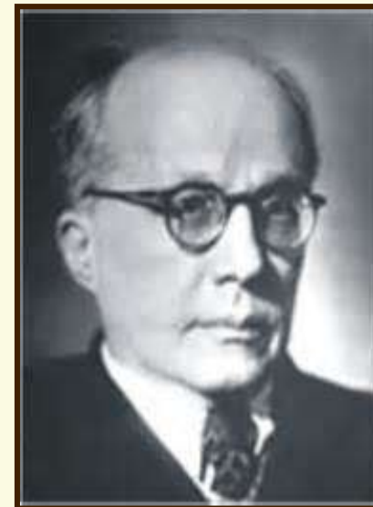
С. Л. Рубинштейн