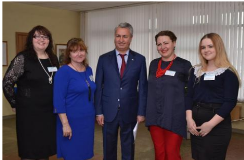
Депутат Государственной Думы РФ Р.А. Азимов