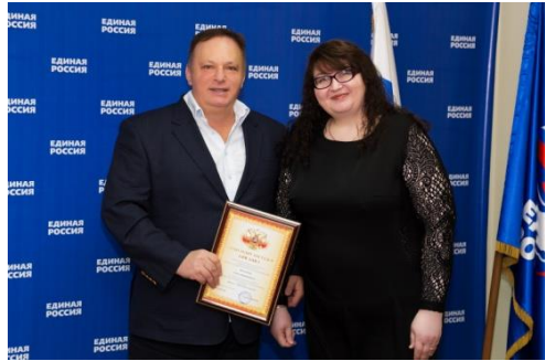
Депутат Государственной Думы РФ О.Д. Валенчук