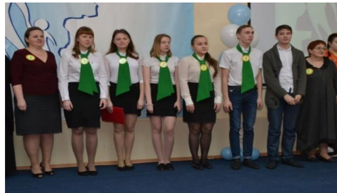
МОКУ СОШ с. Адышево, Оричевского района