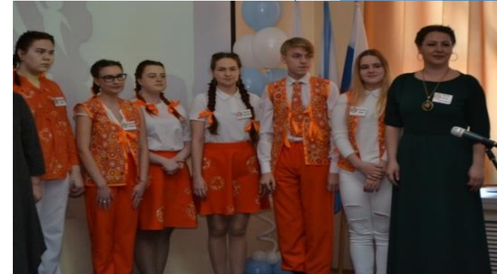
МБОУ СОШ № 56 г. Кирова