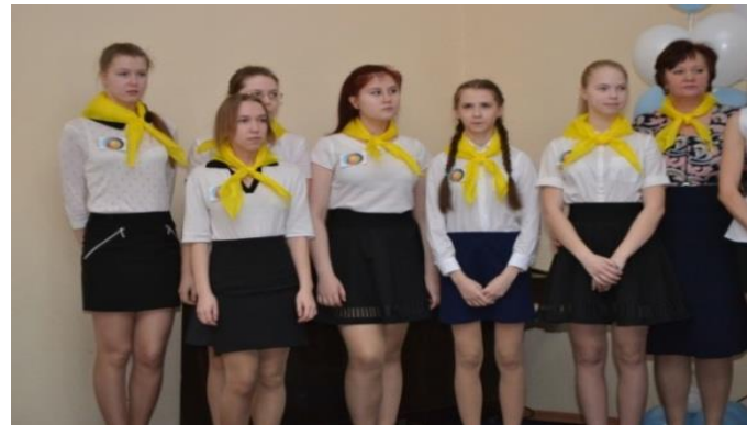
МБОУ СОШ № 18 г. Кирова