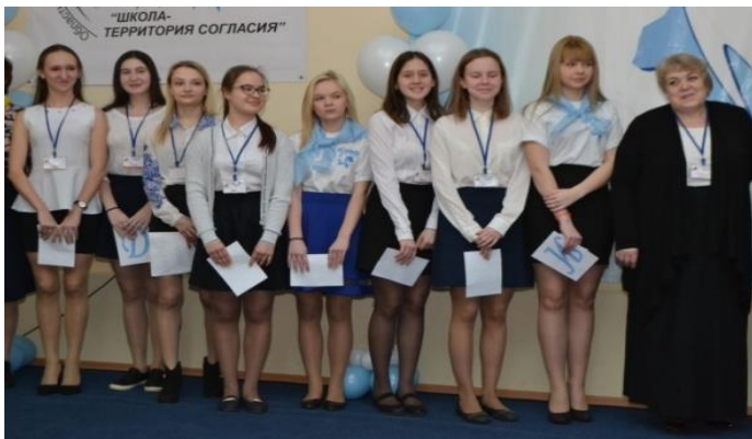
МБОУ СОШ с УИОП № 27 г. Кирова